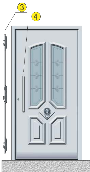
Ansicht von aussen Vue d'extérieur Vista da fuori Gezien vanaf de buitenzijde